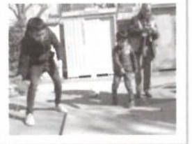
子どもも大人も コマに夢中!

【問合せ】 筆筈地区協議会事務局 (筆筈町特別出張所内) ☎03-3260-1911