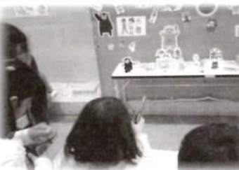
▲安全な射的を利用した