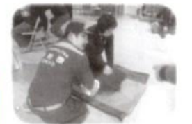
▼牛込消防団も協力して講習