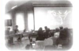
▼紙芝居「防災赤ずきんちゃん」の迫力のある語り