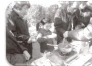
ミツロウ細工体験

1月22日（日）に開催された「牛込筆筈地域まつり」に、筆筈地区協議会「地域の絆分科会」では、恒例の「ふれあいひろば」をあさひ児童遊園内に設けました。火鉢を囲んで、温かいお茶を飲みながら、地域の方の交流を深めることが目的です。前日準備も含め、社会福祉協議会からの3名のボランティアさんや、筆筈地区の地域交流館の職員さんにもご協力いただき、今回も運営することができました。