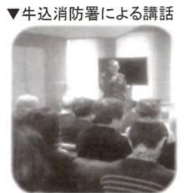
▼牛込消防署による講話

2月18日（土）に、「地域の絆分科会」主催の学習会「災害が起きたら、あなたは？」を、牛込筆筈地域センター5階コンドルで開催しました。震災の教訓を語る紙芝居「防災 赤ずきんちゃん」、牛込消防署による「AED講習会」など、盛りだくさんの内容で行われました。参加者からは、「紙芝居はわかりやすく、語り部の方もお話しが上手なので、子どもたちにも是非見て聞いてほしい。」「心肺蘇生法のやり方や、AEDの機種も常に変化しているので、今後も開催してほしい。」などの感想が寄せられました。