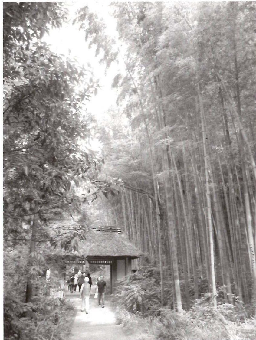
御殿場とらや工房の山門