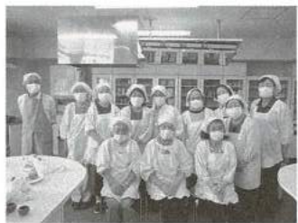
『グループひまわり』のメンバー

◎初めて参加された方 目の前には、主菜・副菜と良く考えられたお食事が並んでいます。皆さん楽しそう。何度か来ているうちに親しくなって、ついおしゃべり。まだコロナ禍なので、黙食して下さいのがかかると。家でのお食事は良いものですが、ただ男の方の少ないのが残念です。